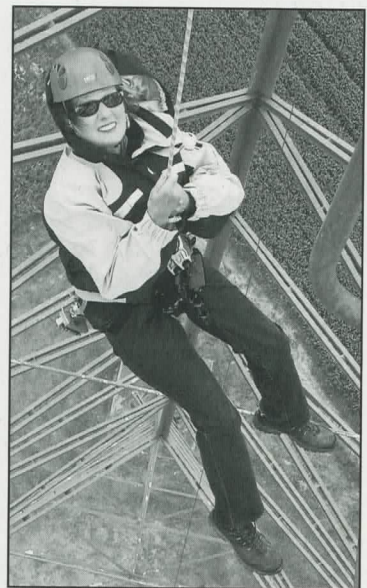
La descente en rappel est géniale. Comme quoi le métier de journaliste a sa part d'aventure